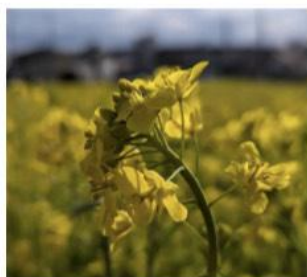
一眼レフカメラにて