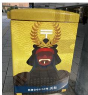
家康公ゆかりの地 浜松